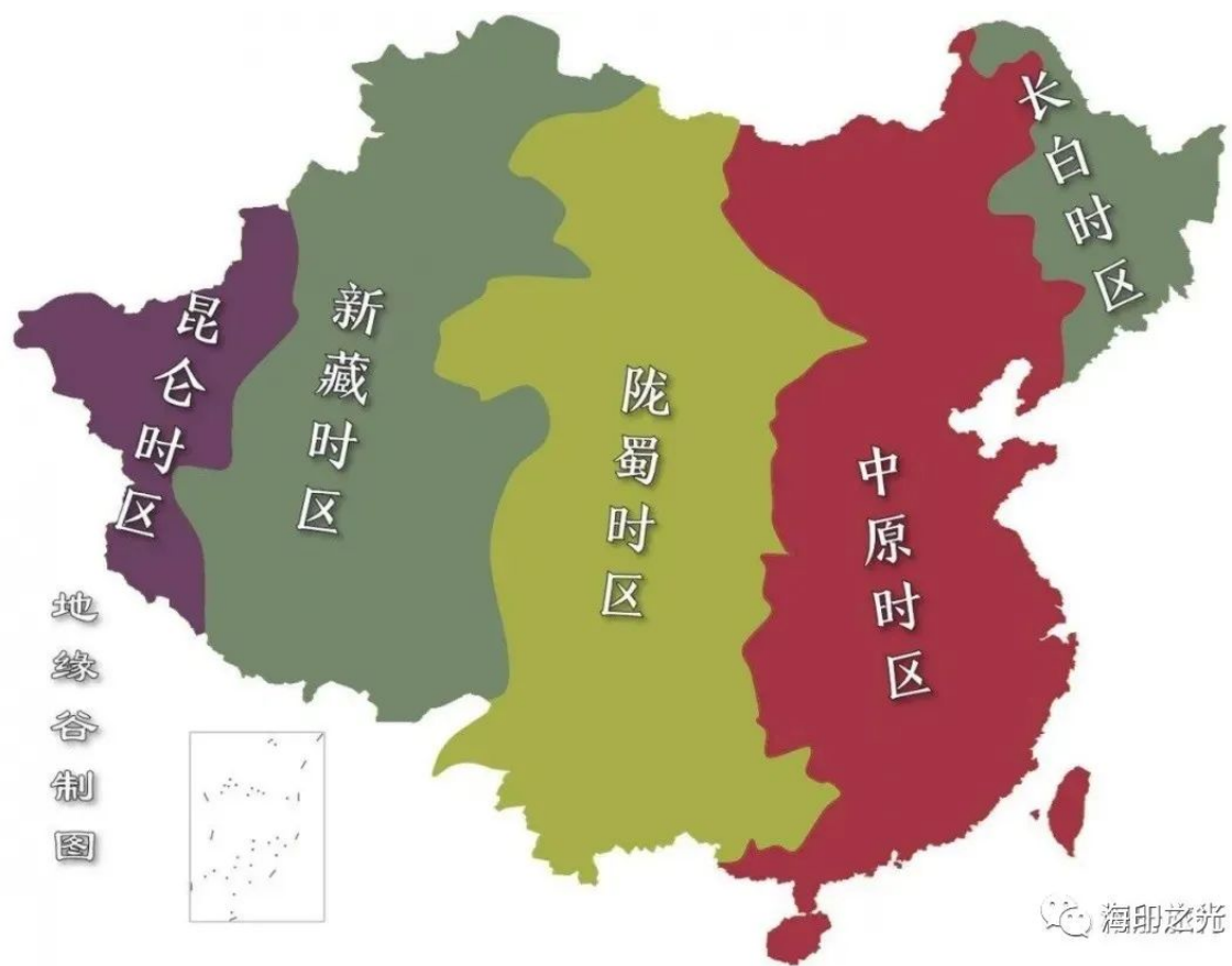
民国时期颁布的中国5个时区。