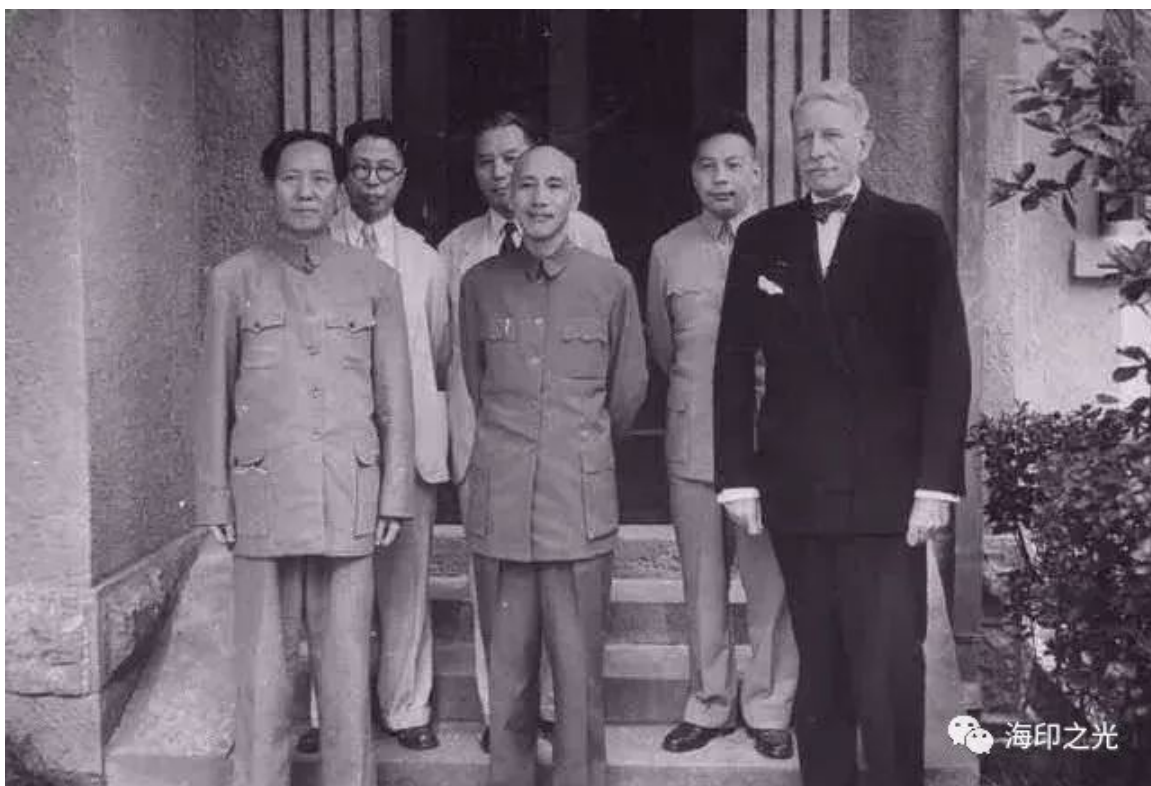
(1945年8月赫尔利在重庆谈判调停国共和谈)