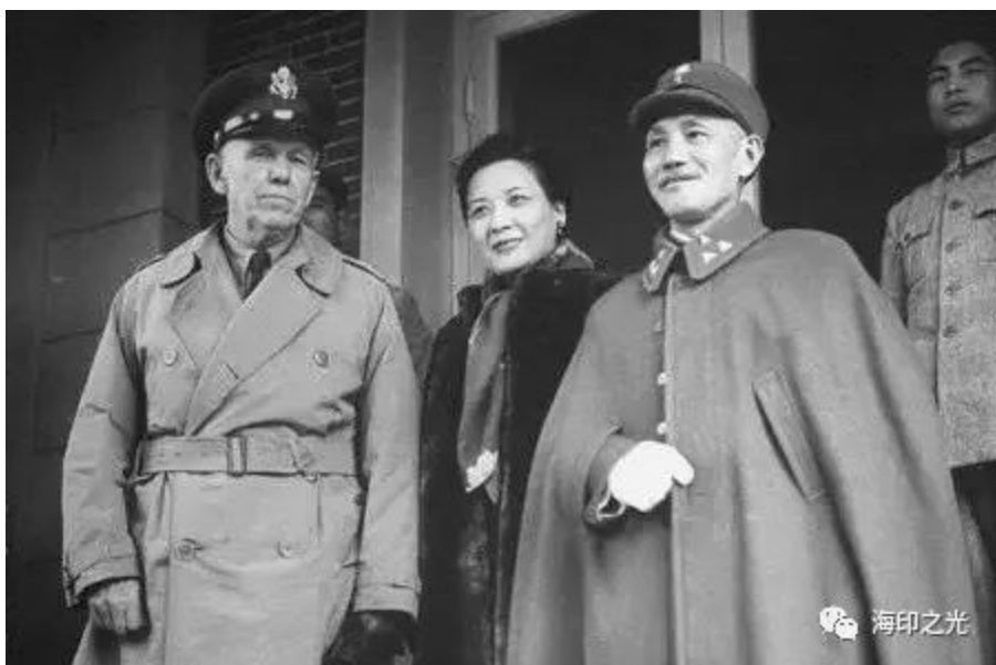
(马歇尔在重庆会见蒋委员长调停国共和谈)