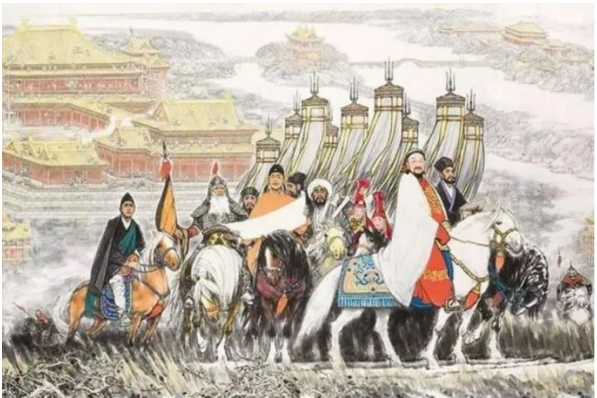
马振声、朱理存《忽必烈与元大都》