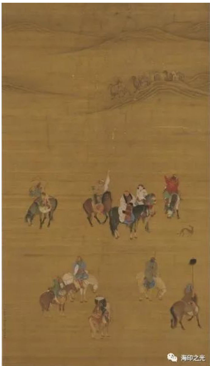
1280年刘贯道作《元世祖出猎图》（台北故宫博物院藏）

刚看到这张图我哑然失笑了。这不就是元世祖忽必烈的八字干支取像吗？用干支取像，来描绘一下忽必烈的命格（四柱+三垣，七柱），初只见：秋高草黄，一片肃杀之气，其意境，就象这个《元世祖出猎图》一模一样。