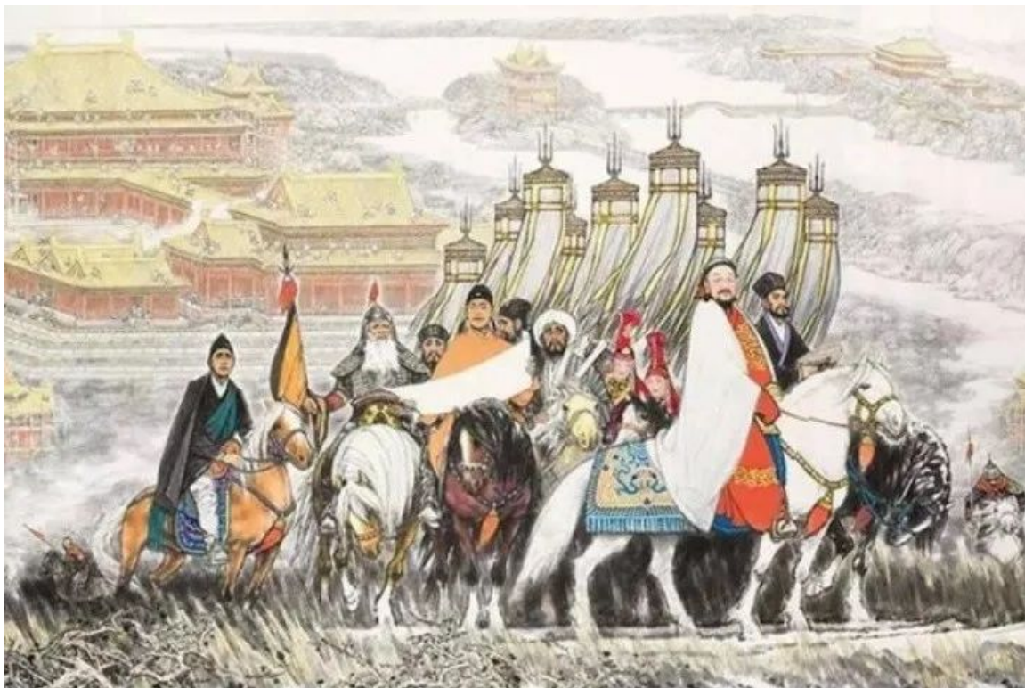
马振声、朱理存《忽必烈与元大都》