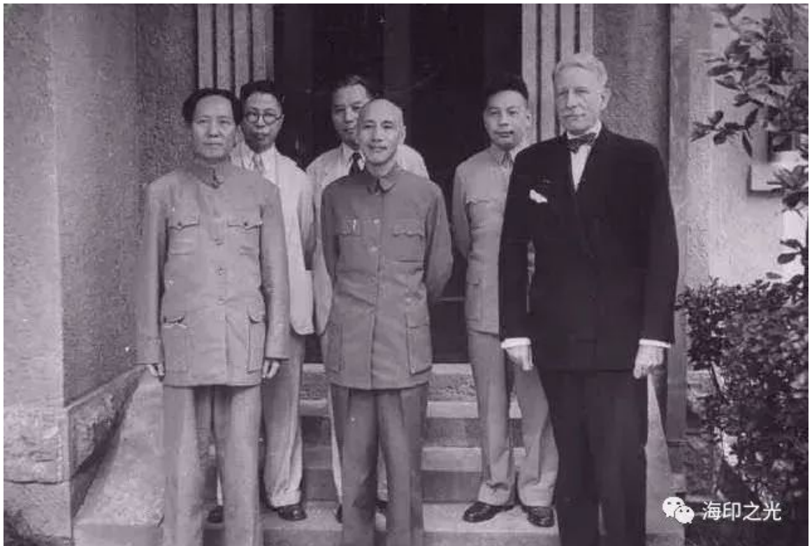
(1945年8-10月重庆谈判国共和谈)

•文钱斗米无人赅：官军、日寇都强征民粮，给的价很贱，粮并不贵但没人卖(赅)，几乎买不到。】