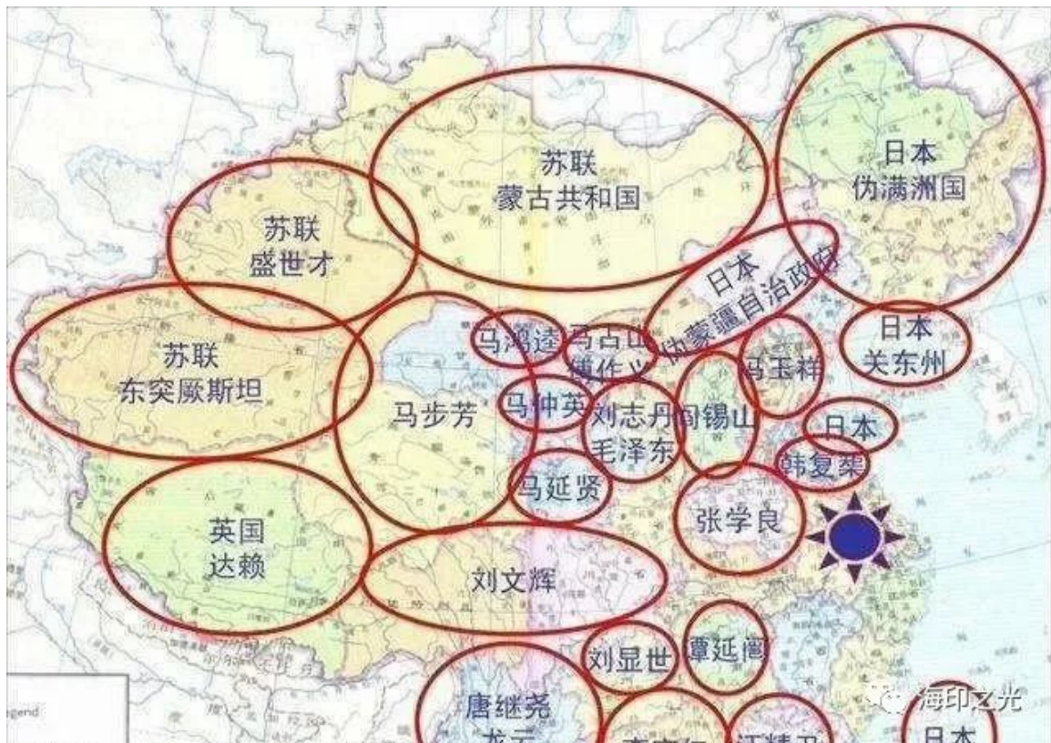
(1936年各方势力形势图)