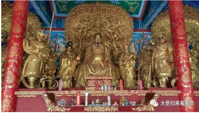
(真武大帝塑像，左右龟蛇二将护法)

【●补充：2005年7月初，在北京白云观吕祖殿，老道长告诉我：蒋和毛都是“小天罡”，是真武大帝脚下的一龟一蛇(他的俩徒弟)，真武派他俩先下来护世。灵龟得势不饶人对灵蛇太狠了往死里逼，结果俩人又打起来了，灵蛇反倒赢了。下一个圣君是真武大帝下来的，才能真正统一天下。