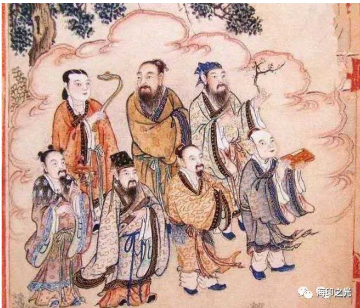
(全真七子，都是王重阳的徒弟)

三元九运180年一个轮回(3个60年，分上中下三元)。4轮是720年，5轮900年。