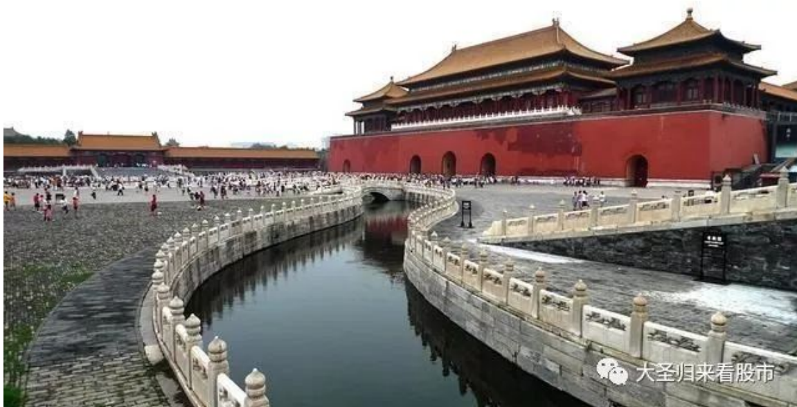
（ 故宫太和殿前玉带河，雕栏玉砌应犹在，朱颜未曾改。 ）