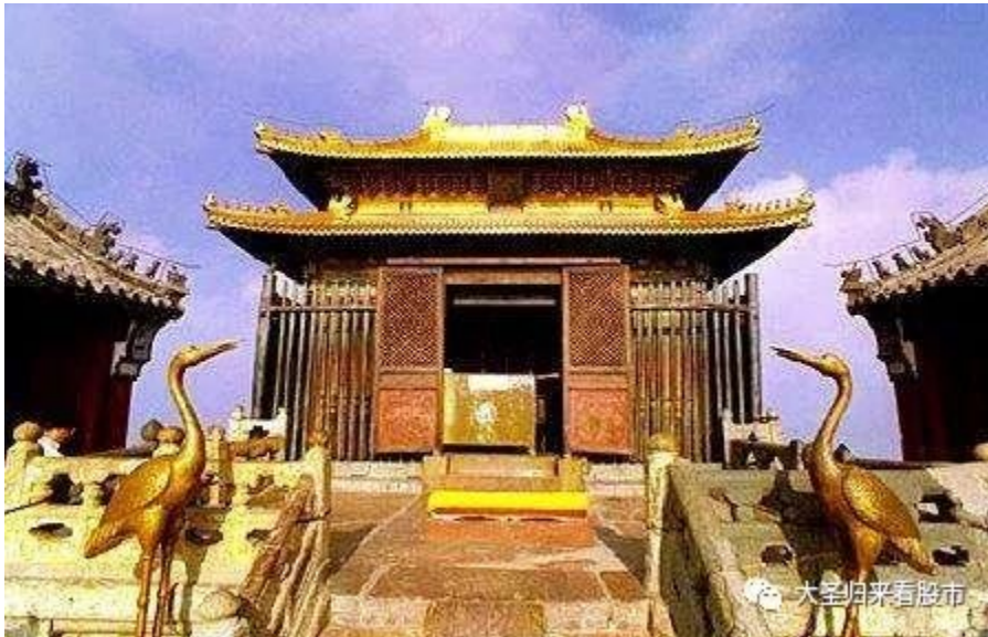
(武当山真武金殿，明成祖敕建，每一个构件都是紫铜铸造)

现在武当山信奉的主神就是真武大帝，山顶有明成祖建的真武大帝金殿。道经中称他为“镇天真武灵应佑圣帝君”，简称“真武帝君”。民间称荡魔天尊、报恩祖师、披发祖师。明朝以后，在全国影响极大，近代民间信仰尤为普遍。又受封为“三教之祖”(儒释道三教，他都当过祖师)。