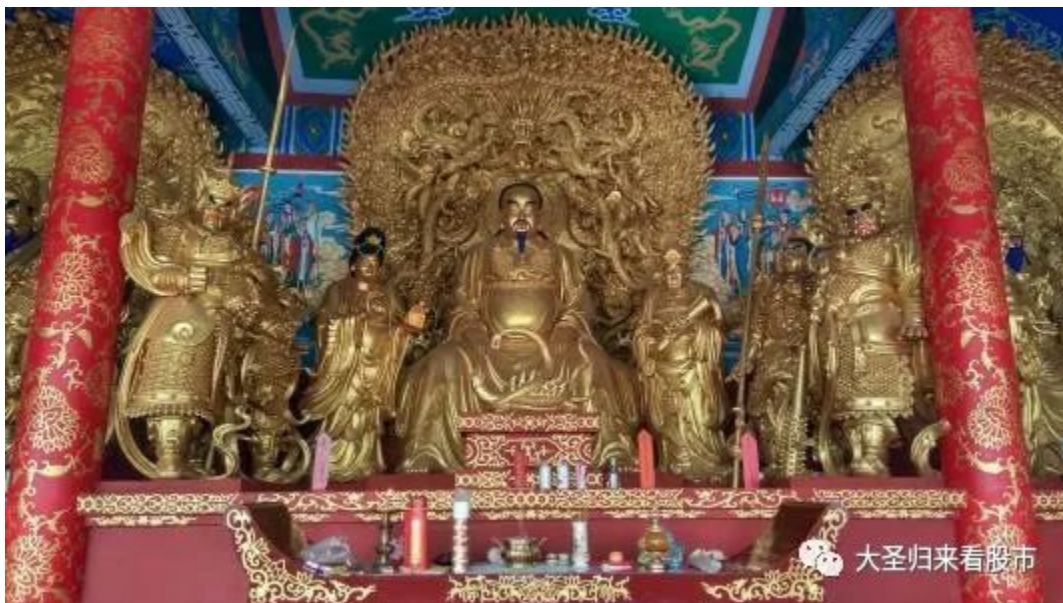
（真武大帝塑像，左右龟蛇二将护法，金童玉女记录善恶）

明代是真武大帝声势显赫、民间信仰最为普遍的时期。明朝初期，朱元璋的儿子燕王朱棣发动“靖难之变”，夺取了王位，传说真武大帝显灵相助，因此朱棣登基后，即下诏特封真武为“北极镇天真武玄天上帝”，并大规模地修建武当山的宫观庙堂，建成八宫二观、三十六庵堂、七十二岩庙、三十九桥、十二亭的庞大道教建筑群，使武当山成为举世闻名的道教圣地，并在天柱峰顶修建“金殿”，奉祀真武大帝神像。明代宫廷内和民间普遍修建了大量的真武庙。